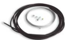
KA1 set metalen kabel van 6m voor KIO