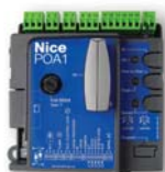
POA1 reserve-besturingseenheid, voor PP7024