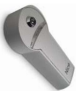
KIO sleutelschakelaar met ontgrendelingsmechanisme voorzien van metalen kabel