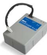
PS124 batterij 24V met geïntegreerde batterij-oplader