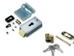
PLA10 verticaal 12V-elektrisch slot (verplicht voor vleugels langer dan 3m)