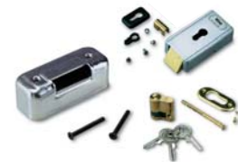
PLA11 horizontaal 12V-elektrisch slot (verplicht voor vleugels langer dan 3m)